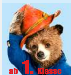
ab 1. Klasse