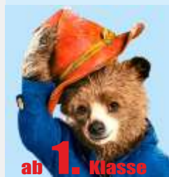
ab 1. Klasse