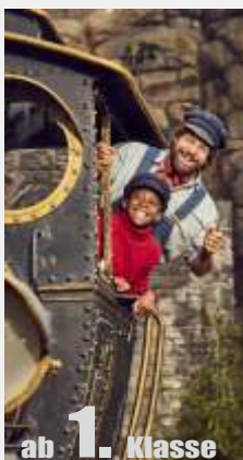
ab 1. Klasse

Dem jungen Publikum werden fraglos die Augen übergehen. Sowie die berühmte alte Melodie angestimmt wird von der Insel mit den zwei Bergen, geht das Herz auf.