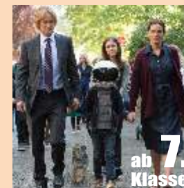
ab 7. Klasse