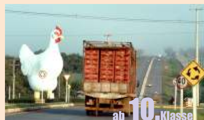
ab 10. Klasse