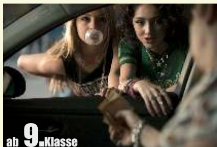
ab 9. Klasse

Tigermilch zeigt erstaunlichen dramaturgischen Mut, bis hin zu einem Finale, das einen hochgereckten Arm mit Freundschaftsband anstelle eines Happy Ends setzt.“ Welt.de